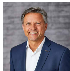
Norbert Schindler Weissman Austria GmbH