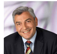
Klaus Welser Weissman Austria GmbH